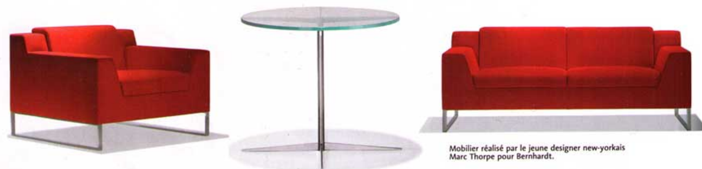
Mobilier réalisé par le jeune designer new-yorkais Marc Thorpe pour Bernhardt.